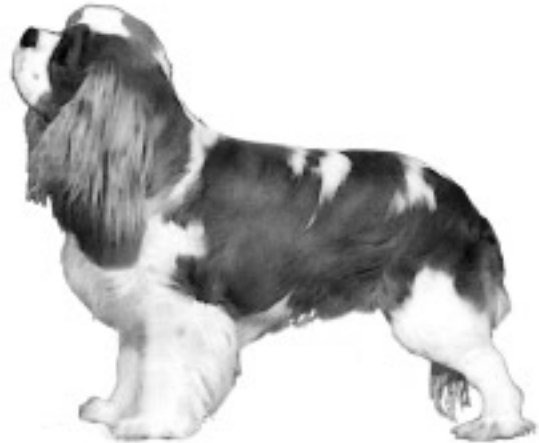
Fig. 14 Grov benstamme og noe for dypt og grovt hode med for mye panne. Grove benstammer og hoder er dessverre en vanlig feil hos begge kjønn.