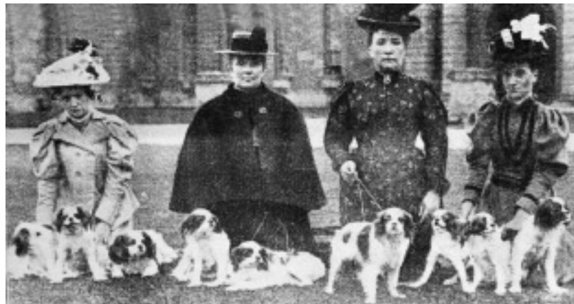
Fig. 3 Dette fotografiet fra 1898 viser Blenheim spaniels tilhørende Hertugen av Marlborough.

Vi vet også at Dronning Victoria hadde en tricolorfarget dvergspaniel, “Dash”, som levde fra 1833 til 1840. På gravstenen står det bl a.: “Her ligger Dash, yndlingsspanielen til hennes majestet Dronning Victoria, etter hvis ordre denne støtten er reist.”