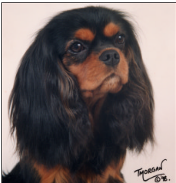
Fig. 31 Black and tan hannhund.