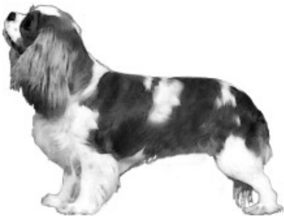
Fig. 13 Både lang og litt lavstilt - dessverre ikke noen uvanlig feil de siste 10-15 årene.