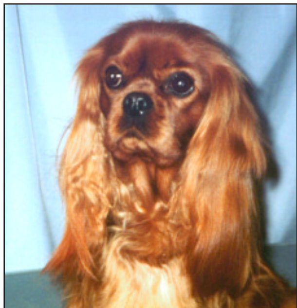
Fig. 32 Ruby tisper.