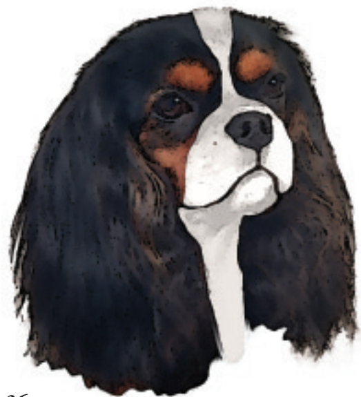
Fig. 36 Trikolor.