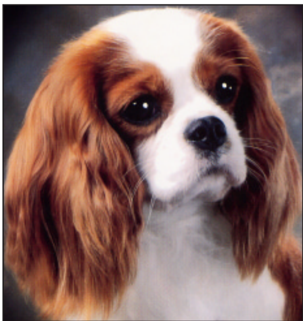
Fig. 29 Blenheim tisper.