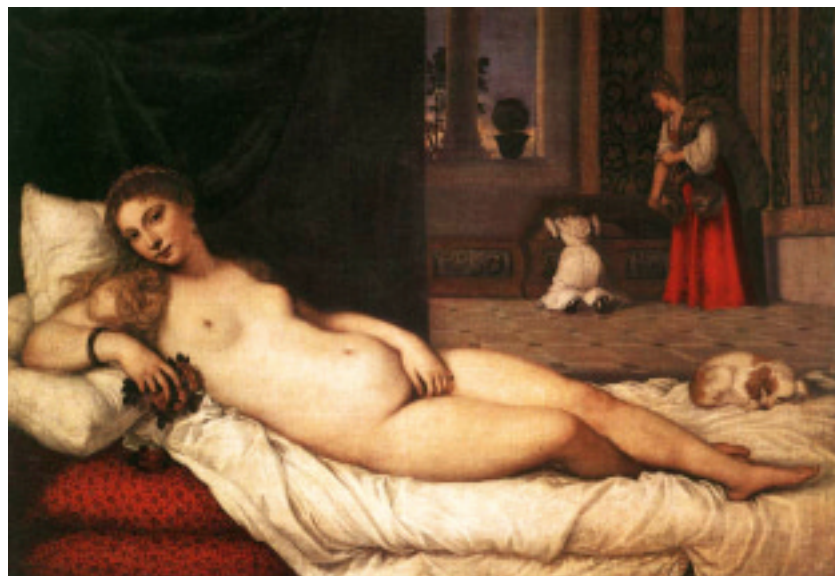
Fig. 1 Tizians "Venus fra Urbina", malt omkring 1538.

Dronning Elisabeth I's lege Dr Johannes Caius beskrev i sitt verk De Canibus Britannicus disse hundene som "Spaniell gentle or comforter - a delicate neat and pretty kind of dog". Han fortalte dessuten at hundene kunne kurere alvorlig mageonde. Sykdommen forlot mennesket og tok bolig i hunden. "Erfaring -", skrev han, "- kan bevitne. For denne typen hunder kan plutselig bli syke, eller enkelte ganger dø, uten noen ytre årsak." Dvergspaniels var Stuart-familiens favoritt, og historien om henrettelsen av Maria Stuart er godt kjent; etter at hun hadde blitt henrettet fant man en forskremt liten hvit og svart spaniel i hennes erme.