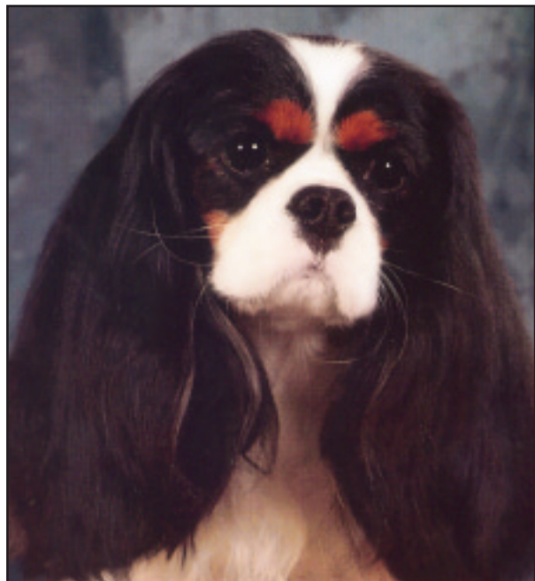
Fig. 30 Trikolor hannhund.