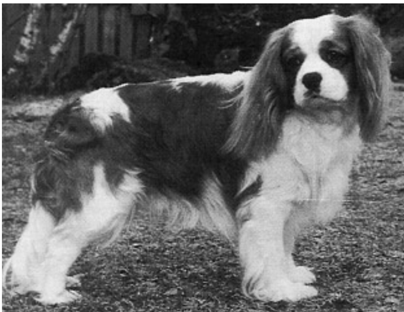
Fig. 9 INT NORD UCH NV-85 SV-91 Sperringgårdens Cylvester.

Også til Norge kom de første cavalierene i 1961 men det skulle gå ti år før de fikk noen større utbredelse (17 registrerte valper i 1972, mot bare én året før). 70-tallets "toppår" var 1979 hvor det ble registrert 86 valper. Den norske popularitetsboom'en begynte i første halvdel av 80-tallet. Fra 1983 til toppåret 1991 steg