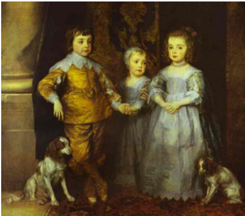
Fig. 2 Charles I's barn, Charles II til venstre, malt av A. van Dyck (1599 - 1641).

Både King Charles I og II hadde dvergspaniels, og det var den siste, King Charles II, som gav opphavet til rasens navn. Det er ingen tvil om at han eide mange hunder som fulgte ham overalt. Dagbokskriveren Samuel Pepys irriterte seg med all tydelighet over at kongen brukte mer tid på sine små hunder enn å ivareta sine kongelige plikter. Det sies at kongen til og med fikk endret lovverket, slik at hundene skulle få tilgang til de innerste regjeringskontorene ved hoffet, men en slik lov er det ikke blitt funnet dokumentasjon for - det er imidlertid ingen som tviler på, takket være Samuel Pepys ord, at hundene alltid var ved kongens side. På grunn av kongefamiliens nære bånd til det franske hoffet, er det ikke usannsynlig at det foregikk en viss utveksling av hunder mellom England og kontinentet. Et kjent maleri av kongens yngre søster som bodde i Frankrike, Henrietta D'Orleans (P. Mignard, ca 1665), viser en kontinental dvergspaniel med flat skalle, lange, høyt ansatte, hengende ører og runde, mørke øyne. Kvinnemotiver med slike hunder i fanget finnes på flere samtidige malerier fra kontinentet.