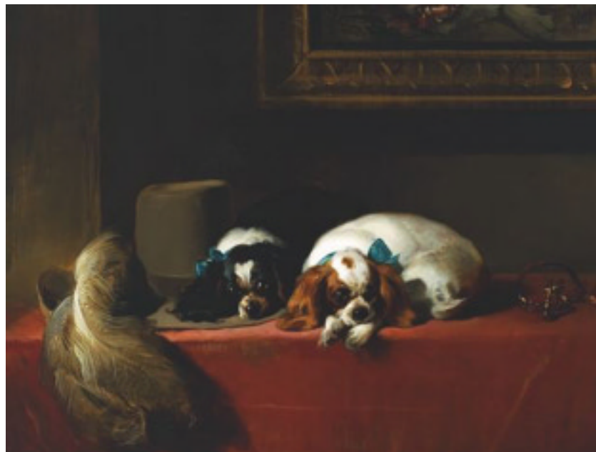
Fig. 5 “The Cavalier's Pets” av E. Landseer, 1845.

Eldridge selv fikk aldri oppleve det som skulle skje senere. I 1928 var det påmeldt fem hannhunder og hele ni tisper. Hannhunden “Ann's Son” vant hannhundklassen, noe han også gjorde de to påfølgende årene (prisen på £25 var satt opp hele fem år). Ann's Son var en 6½ kg tung dvergspaniel med en helt spesiell utstråling. Han var