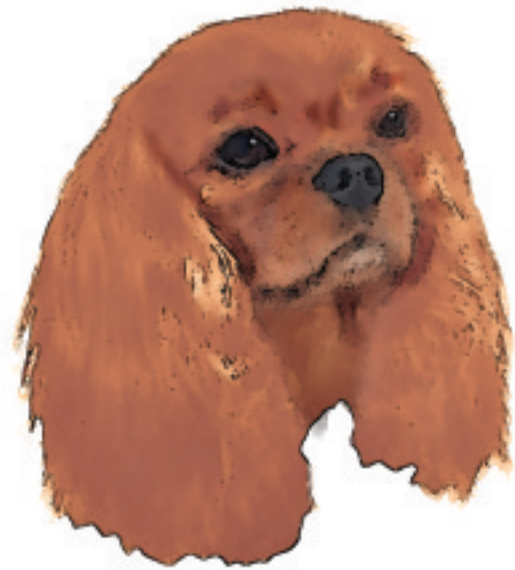
Fig. 34 Ruby.