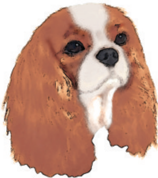
Fig. 35 Blenheim.