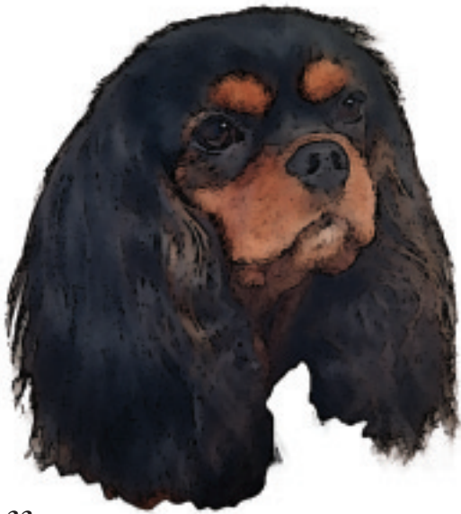
Fig. 33 Black and tan.