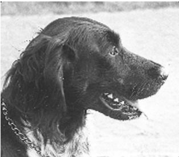
Amsel v. Bramgau