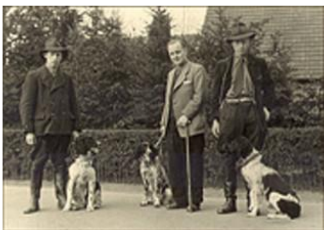
Camillo, Cunni und Cilly

I 1919 stiftet tilhengere av disse svart-hvite langhårete Vorstehhundene “Forening for renavlede langhårede svart-hvite Große Münsterländer Vorstehhunder” i Haltern i Münsterland. Med opprettelsen av denne foreningen lyktes man å bevare denne gamle tyske langhårvarianten fra å dø ut. Det første man gjorde var å registrere restene av de svart-hvite langhårene i en liste for å kunne renavle videre på disse.