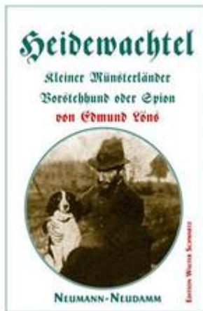
Edmund Löns "Heidewachtel"