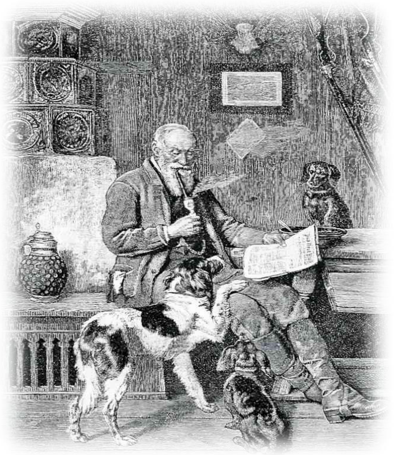
Kleiner münsterländer ble anerkjent som selvstendig rase i Tyskland i 1912 Her ses en gjengivelse av et kobberstikk "Etter dagens arbejde! – av Adolf Elberle ("Illustrierte Jagdzeitung, Leipzig, 1883")