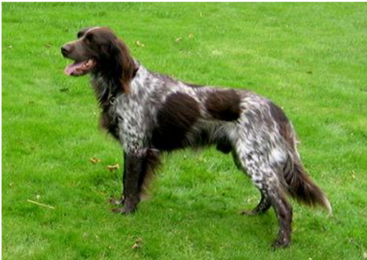
Eksempel på lett avfallende kryss og korrekt kryss.

Hale: Høyt ansatt med fane. Kraftig ved ansatsen, deretter gradvis avsmalnende. I hvile hengende, under bevegelse båret vannrett og ikke for høyt over rygglinjens forlengelse. Bæres lett oppbøyet i ytterste tredjedel.