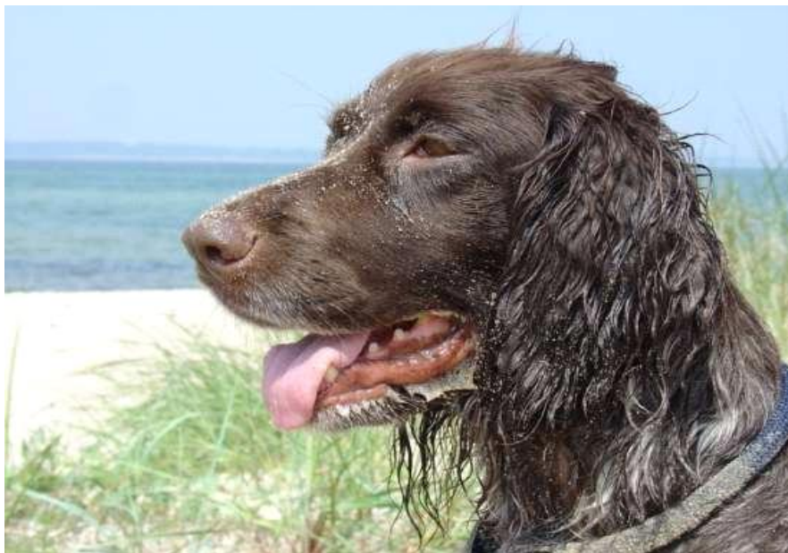
Et tispehode utmerket type. Langt, kraftig snuteparti. Brede, tettliggende og høyt ansatte ører.