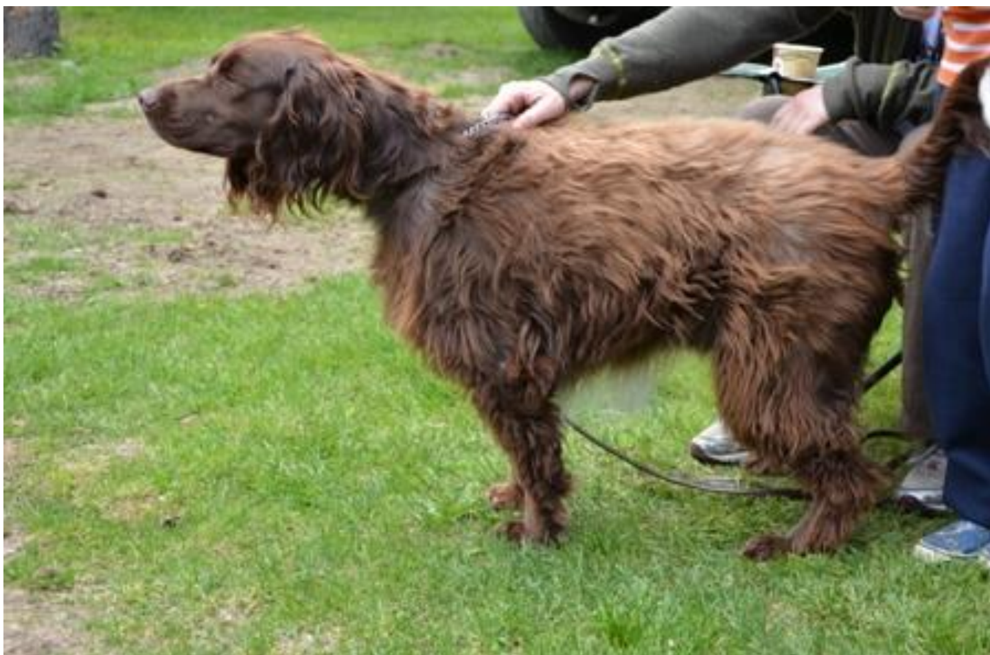
Helt utypisk kleiner münsterländer. Diskvalifiserende.