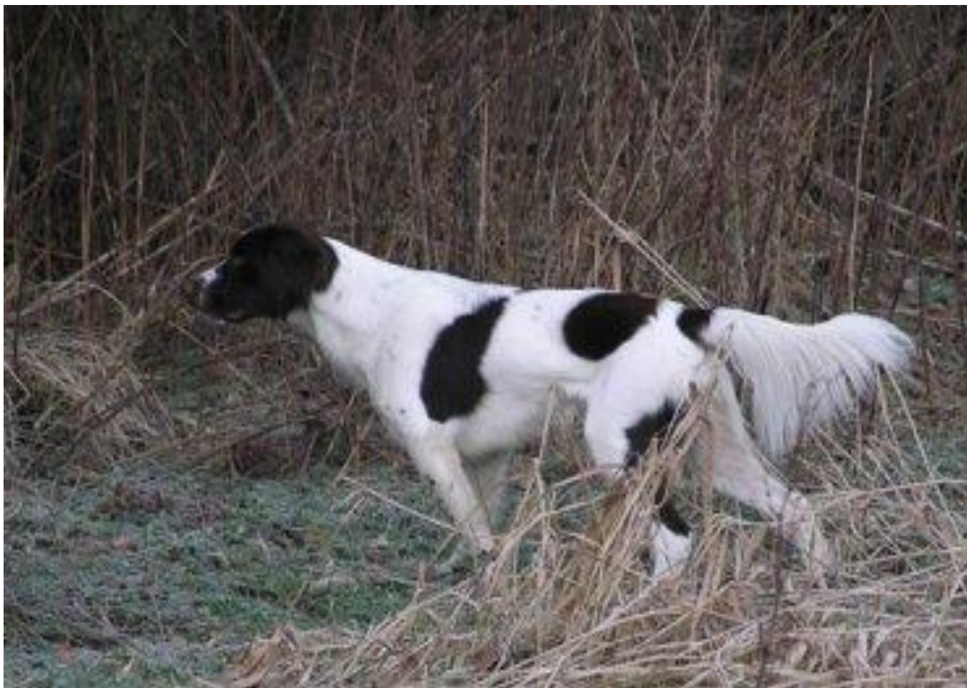
Eks. på korrekt båret hale