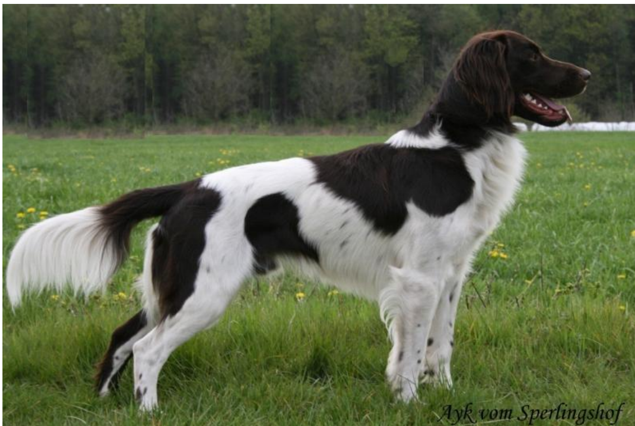
Hann av utmerket type