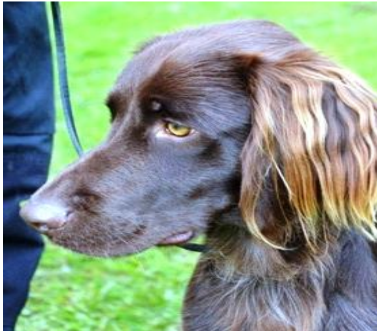
Et tispehode med for lett snuteparti. Leppene skulle vært strammere samt kraftigere underkjeve. Lyse øyne.