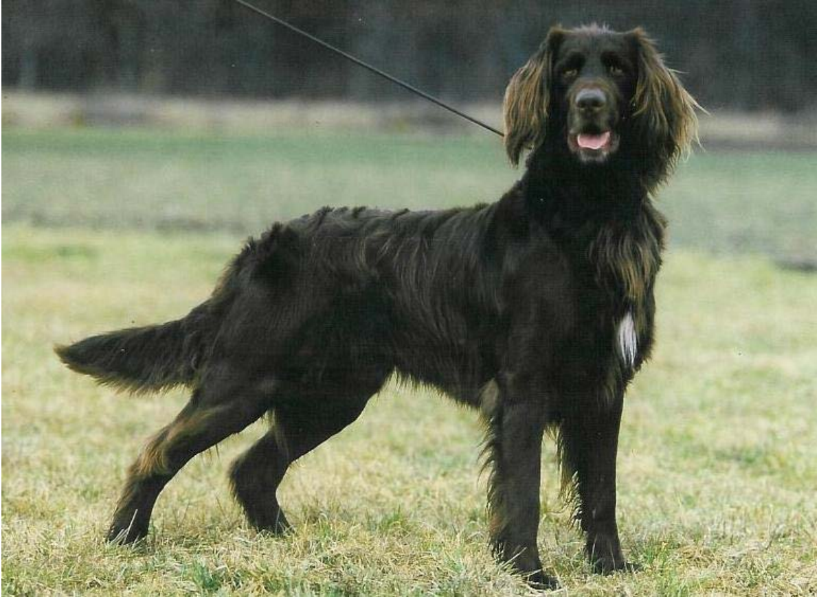
Heilbrun med brystfleck (tysk)