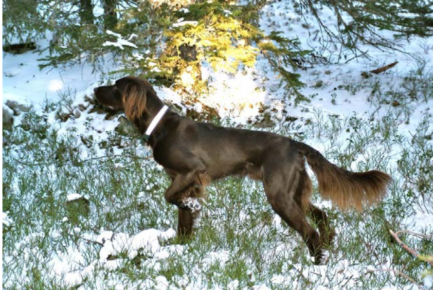
En ung hannhund av god type, godt vinklet, 65 cm og 28 kg