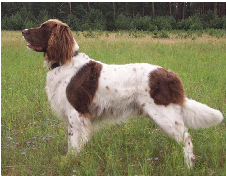
Brun og hvit