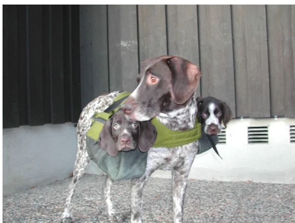
En korthåret strihår – rasetypisk, skal ha 0 pr