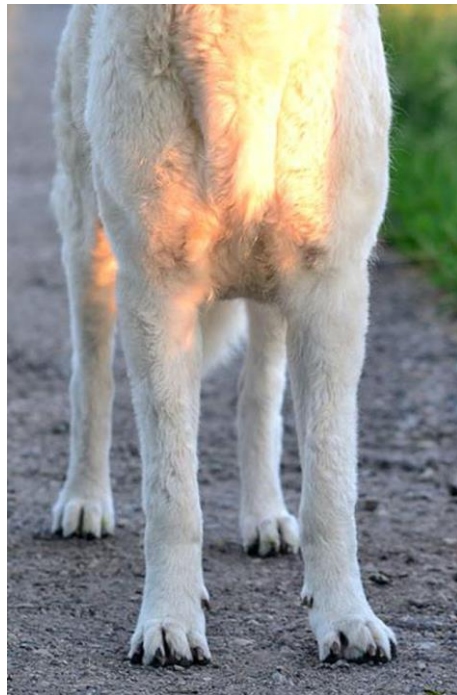
Utmärkta framställ och exempel på korrekt tass.

Framtassarna skall vara runda eller något ovala och fasta. Tårna skall vara korta och så högt välvda som möjligt. De skall vara elastiska och väl slutna med spänstiga och svarta trampdynor. Klorna skall vara hårda, kraftiga och svarta eller skiffergrå.